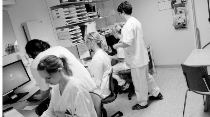
BLIR SYKE AV JOBBEN: Sintef slår fast at rundt en tredel av sykefraværet er arbeidsrelatert og dermed mulig å forebygge, skriver Eli Gunhild By.